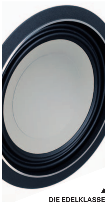
▲ DIE EDELKLASSE:

Canton produziert sämtliche Chassis selbst. In der Tiefe schwingt eine Membran aus Aluminium-Oxyd-Keramik – ein großartiger Mix.